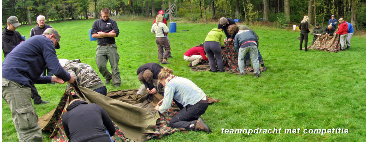
teamopdracht met competitie